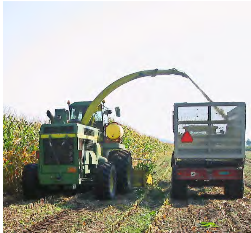
Nach dem humuszehrenden Mais ist ein tieferer Humusgehalt zu erwarten.

Der Humusgehalt im Boden kann mit dem Wasserstand in einem Stausee verglichen werden, der von einem Fluss gespeist wird. Organische Düngung durch Hof- oder Recyclingdünger sowie die Anlage von Kunstwiesen, Gründüngungen oder das Belassen von Ernteresten auf dem Feld bestimmen, wie viel Wasser in den Stausee fliesst beziehungsweise wie viel Kohlenstoff in den Boden gelangt. Die angebauten Hauptkulturen wiederum beeinflussen den Abfluss aus dem Stausee beziehungsweise den Humusabbau im Boden. Humuszehrende Kulturen wie Kartoffeln, Zuckerrüben oder Mais bedeuten einen grösseren Abfluss, während Getreide oder Raps einen mittleren und Körnerleguminosen nur einen geringen Abfluss bedeuten. Doch nicht nur die Bewirtschaftung, sondern auch Standorteigenschaften wie die Zusam-