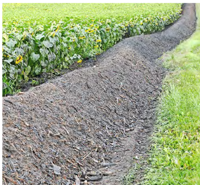
Organische Dünger wie Kompost bringen Kohlenstoff in den Boden.

Wenn man sich nicht für den genauen Humusgehalt interessiert, sondern einen Überblick über den Betrieb und dessen Bewirtschaftung erhalten möchte, kann die Humusbilanz von Agroscope helfen. Auf der Webseite