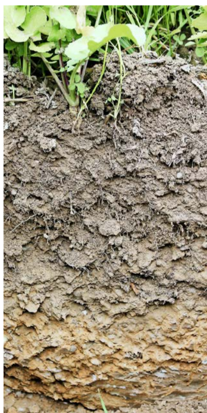
Nicht nur im Unterboden wurde hier eine Verdichtung gefunden. Die Messerprobe zeigte auch einen deutlichen Widerstand im Bereich des Sämaschinen-Horizonts.

Ermutigt und mit vielen praktischen Ideen für die Förderung der Fruchtbarkeit ihrer Böden ausgerüstet, traten die Besucherinnen und Besucher des Bodenfruchtbarkeits-Tags die Heimreise an. ■ Katrin Carrel, Strickhof